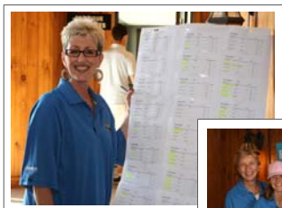
Some of our amazing volunteers.

this year's was indeed just a perfect day.