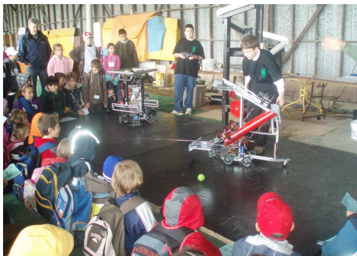
Students from throughout the board get to spend a day in St. Lazare at the John D. Schofield Science and Technology Day