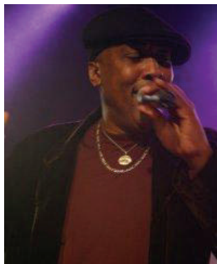
Slim Williams the Planet.

L'événement a mis en vedette les élèves comme mannequins et artistes. Les éclairages, le son et la photographie sont aussi l'œuvre des élèves de Lester-B.-Pearson et la soirée a été rendue encore plus magique grâce à la participation de Slim Williams, un artiste de Motown, qui s'est joint à nous pour chanter quelques-unes des chansons de son plus récent album, Pulse of