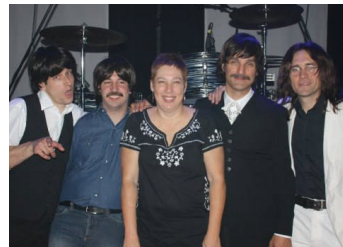
President Suanne Stein Day with the boys in the band

This band have perfect replicas of the Fab Four's "Hard Days Night" suits, note-for-note 3 part harmonies and exact instrumentation, leaving even the most scrutinizing fans